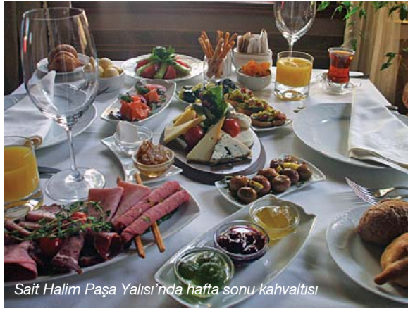
Sait Halim Paşa Yalısı'nda hafta sonu kahvaltısı

noktası olur. Bu süreçte üniversiteyi de kazanmıştır. Şöyle düşünür "Üniversitede turizm bölümündeyim, 80 kişilik sınıfta değişik branşlar arasında tek aşçıyım. Madem Türkiye birinciliği aldım, karar verdim üniversiteli aşçı olacağım." Sonra okul ve çalışmayı birlikte yürütür. 6-7 yıl hiç para kazanmadan meslek öğrenir. Oktay usta bu noktayı şöyle açıklıyor "Normalde budur zaten. Önce almaya başlarsınız. Vermeye başlayınca para kazanırsınız. Bu işi öğrenene kadar çalıştım, mutfak sahibi oldüm, sürekli araştırdım, sabrettim."